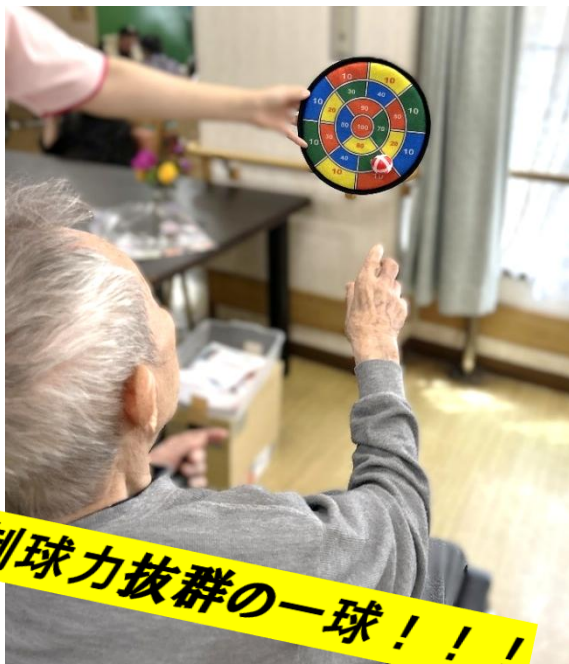
制球力抜群の一球!!!