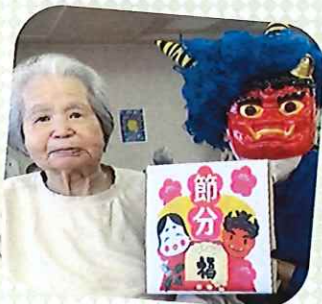
昨年度自粛していた赤鬼・青鬼がいよいよ活動開始！ 今回は各フロアにて開催致しました。