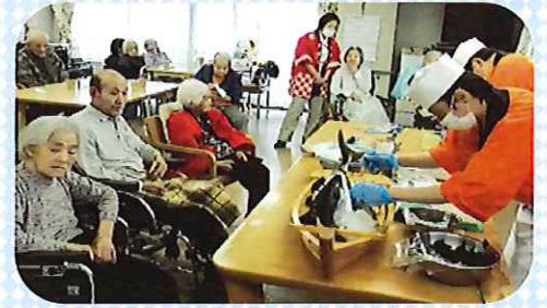
間近で見る魚の解体に、皆さん興味津々です。