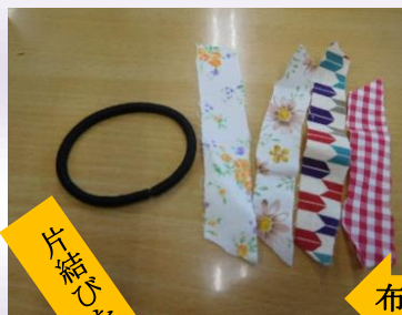
布を細かく切って

工作レクリエーションにて、髪飾り「シュシュ」を作成しました。シュシュと言っても難しい作業は行わず、端切れを髪ゴムにひたすら結んで頂くだけ！皆様、お話しをしながら取り組まれていました。髪の短い方はプレスレットのように腕に。男性ご利用者は奥様へのプレゼントとして作成されていきました。