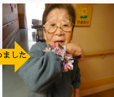
すぐにコツを掴めました